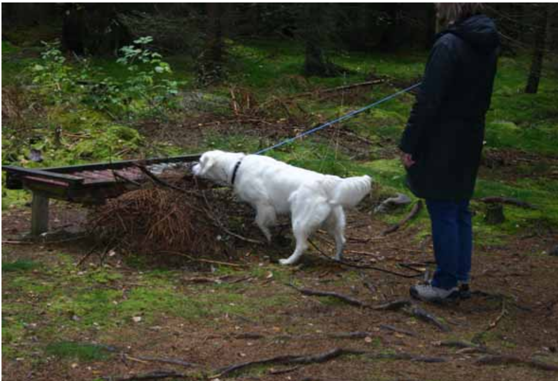
Vad är det som skramlar och låter?