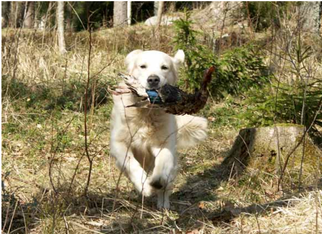
Goldenklubbens klubbmöteshandlingar 2007