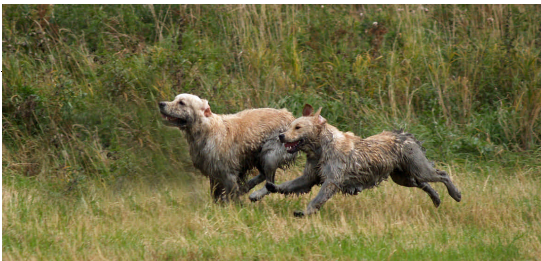
En glad golden retriever är ofta både blöt och smutsig