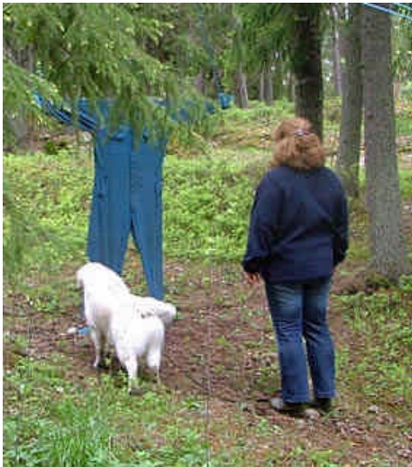
Vad är det här för lustig figur?

Via mentalbeskrivning hund, MH, har vi sedan 1998 t o m 2002 beskrivit sam-