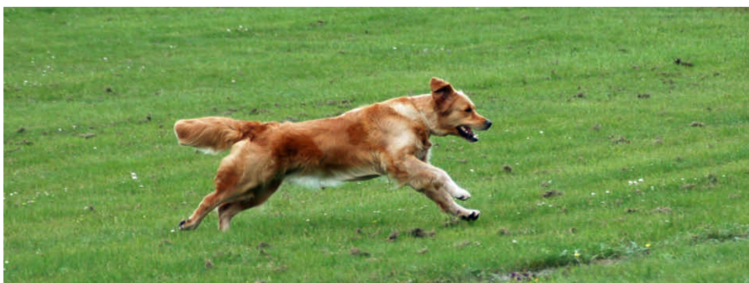
Här är det full fart framåt...

Sammanfattningsvis kan man säga att MH beskrivning tillsammans med funktionsbeskrivning är värdefulla avelsverktyg som komplement till jaktprov och utställningar. För att behålla rasen som en trevlig familjehund och en apporterrande fågelhund är det viktigt att vara observant på rasens mentala egenskaper. Framförallt bör nyfikenheten bli större och rädslorna mindre.