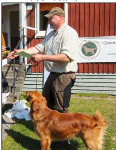
Koffstalunds Duke Magnus Elsius