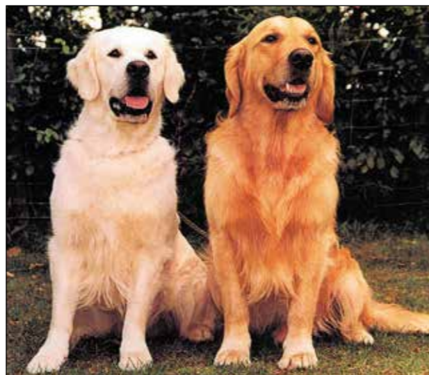
Två hundar av olika familjetyp.

Rasen förekommer i olika så kallade familjetyper. Det beror på att standarden är allmän och ger få detaljerade angivelser. Det ger utrymme för egna tolkningar och är bakgrunden till den variation i utseende som finns, och alltid har funnits, i rasens hemland. Uttrycket familjetyp måste klart särskiljas från begreppet rastyp. Anledningen till att vi kan se en så stor variation av familjetyper, härrör från den hårda uppdelningen mellan olika typer av hundar som fanns hos uppfödare i södra respektive norra England. Man kan generellt säga att hundarna i södra England hade bättre fronter, halsar och skuldror. De var lättare i stommen, hade inte så kraftiga huvuden och var mörka till färgen. Hundarna i norra England var grövre med kraftigare huvuden, bra överlinjer och starka bakställ samt ljusare. Denna markanta uppdelning var gällande från efterkrigsåren fram till slutet av 60-talet. I mitten av 60-talet gjordes några kombinationer där de södra och norra linjerna blandades som fick ett starkt genomslag då de var framgångsrika och fick många efterföljare. Resultatet har blivit att de två gamla typuppdelningarna inte längre finns kvar med samma tydlighet. Eftersom rasstandardens tillåter en bred variation kan man inte framhålla att någon familjetyp är mer korrekt än en annan. I Sverige liksom i England accepteras de olika varianterna i familjetyp så länge de faller inom rasstandardens ramar och kvaliteten och helhet prioriteras över personlig preferens av familjetyp.